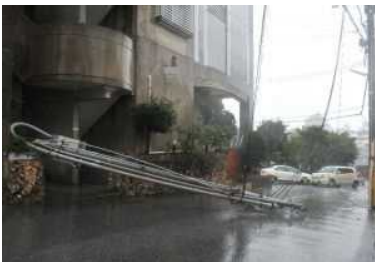
台風の強風で鉄柱が折れ倒れた電柱 =11日午後0時26分、浦添市城間

沖縄、鹿児島両県で15万人以上に避難勧告が出された。住民への避難勧告は沖縄県で名護市など4市1町の6万世帯15万人以上で、鹿児島県でも徳之島町など3町が2716世帯5899人に避難勧告を出した。停電は沖縄、鹿児島で、それぞれ4万戸以上となり、那覇空港が全面閉鎖されるなど交通機関も乱れた。