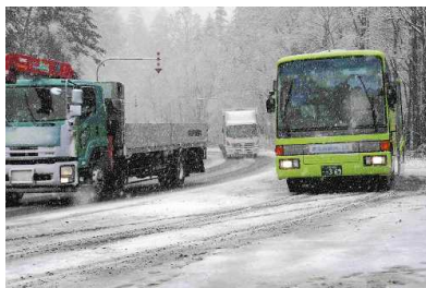
雪で白く覆われた石北峠(14日 午前10時)

北海道は台風19号から変わった低気圧の影響で、上空に11月1日通ったため、寒気が流れ込んだため、東部の石北峠では10センチ以上の雪が積もった。北道では14日午前9時頃には、約10センチの雪が積もった。北道は、この15日昼にかけて多いところでは、10センチ以上で、峠越えには冬タイヤが必要。新千歳空港の発着便も多くが欠航した。また、太平洋側や道東を中心に小中高の計67校が臨時休校。このうち釧路市は全42校、小中学校を休校とした。授業も午前で打ち切った。